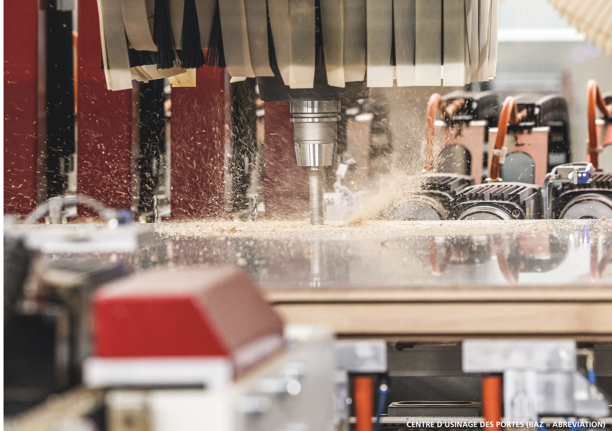
CENTRE D'USINAGE DES PORTES (BAZ = ABBREVIATION)