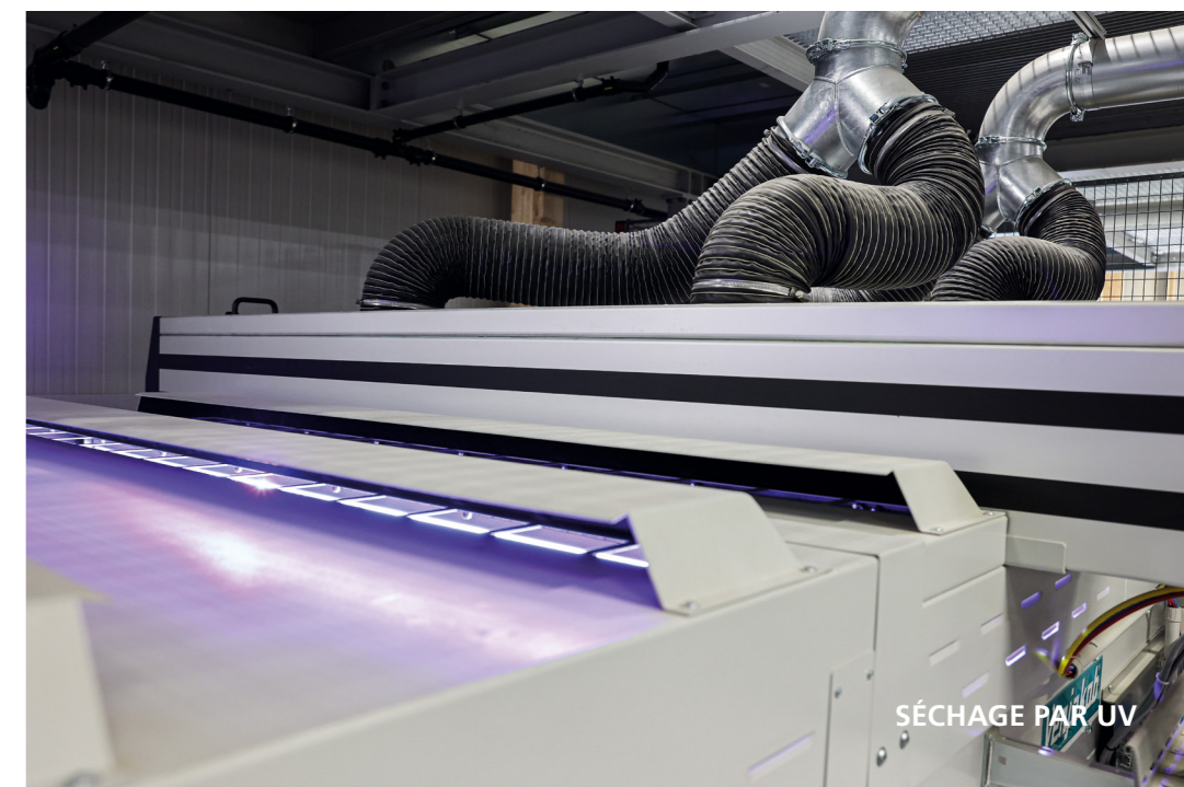
SÉCHAGE PAR UV